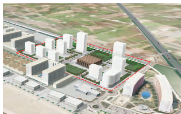
■ Simulación virtual de la edificación y de la configuración de viales propuesta para el sector

El Sector Vinival se encuentra localizado en el término municipal de Alboraya, en un área próxima a la Playa de la Patacona, limítrofe con el municipio de Valencia.