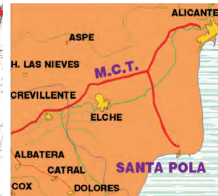
■ Trazado abastecimiento en alta a Alicante y Santa Pola desde la Mancomunidad de los Canales del Taibilla