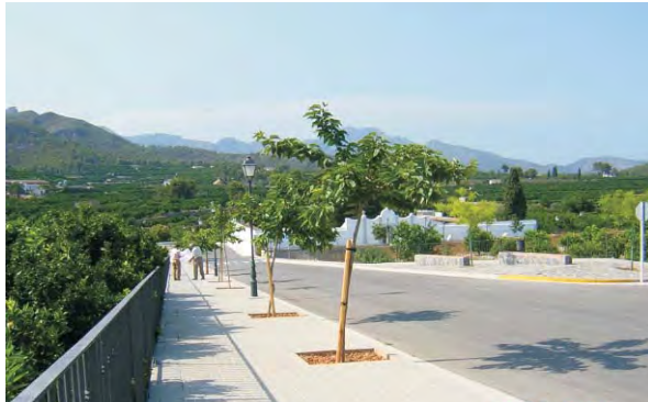
■ Vista del Camino del Cementerio

El desarrollo de nuevos sectores en los municipios conlleva al mismo tiempo la generación de nuevas redes de servicios, entre la que destaca la red de agua potable. Cuando los sistemas de agua potable son de nueva implantación se permite un mayor grado de libertad al proyectista que cuando se tratan de ampliación o mejora de uno ya existente. En el caso del sector 4 de Ròtova, el sistema era de nueva implantación, aunque exigía la conexión con una red ya preestablecida. La población a la que había que dar servicio era de 368 habitantes, generándose una red mallada en la que se incluyó toda la valvulería necesaria.