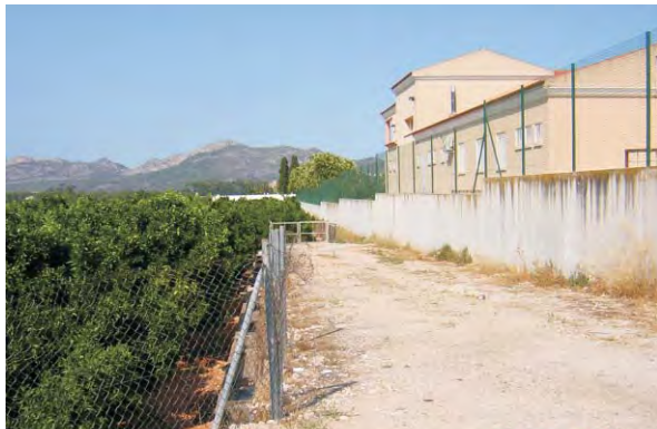
■ Colegios existentes en la actualidad y zona donde se ubicará la parcela dotacional