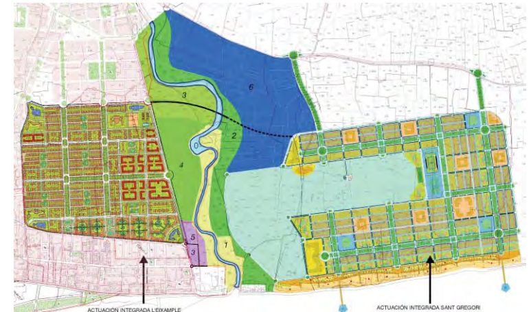
■ Propuestas de usos