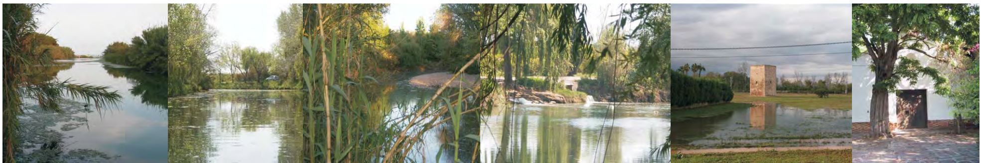
■ Vegetación Parque de Ribera