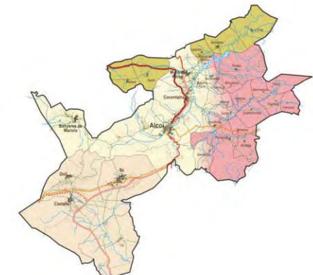
■ Zonificación socioeconomica