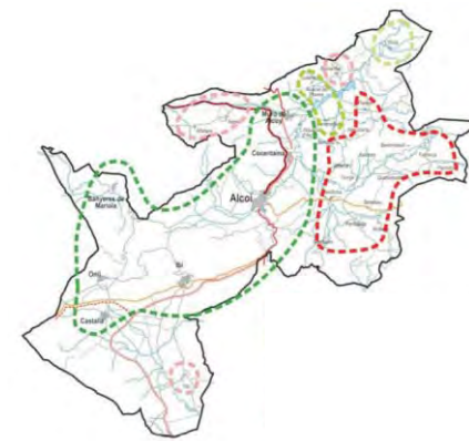
■ Nivel de desarrollo industrial